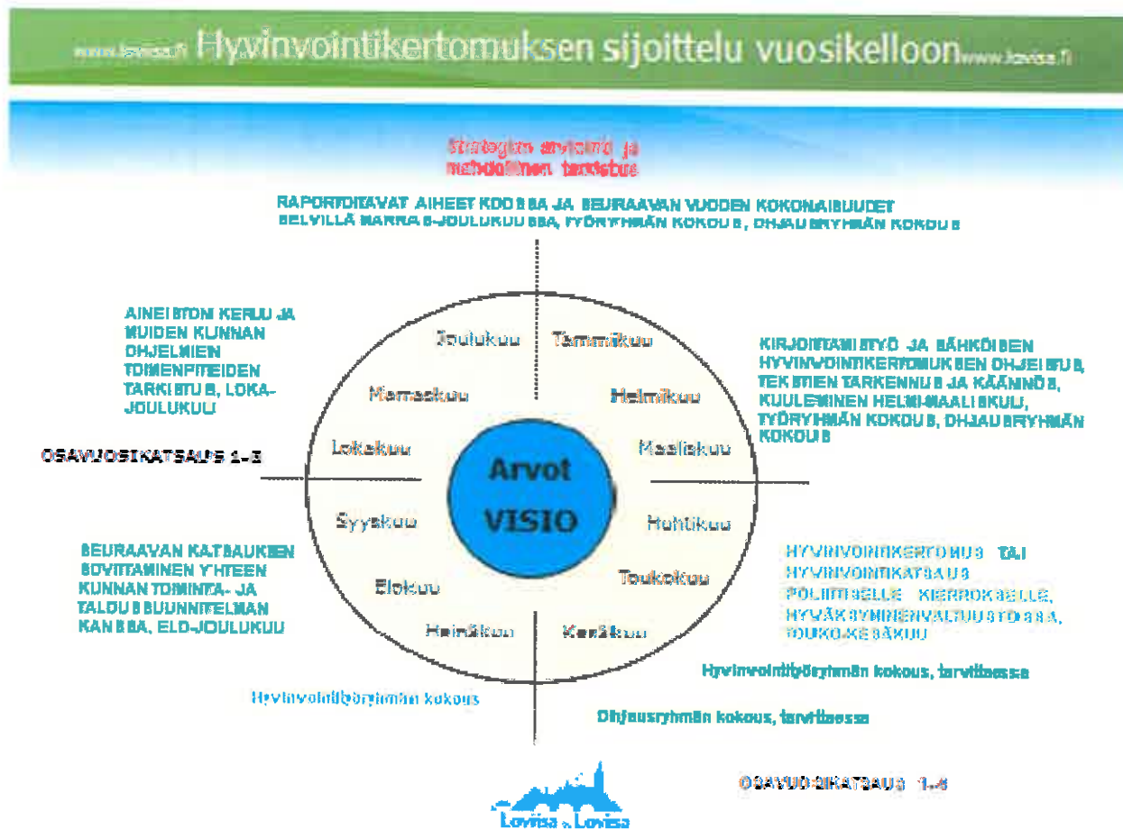
Kuvio 2. Hyvinvointisuunnittelun vuosikello