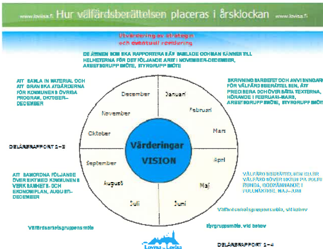
Figur2. Årsklocka för välfärdsplaneringen