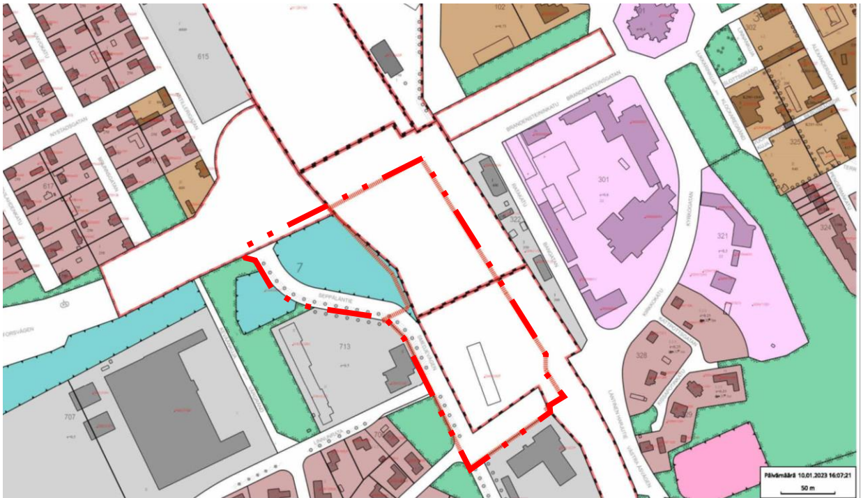
Kuva 3 Ote alueen kaavoja yhdistelevästä ajantasakaavasta

Kaava-alueen länsiosalla Seppäläntien Linnunradan pohjoispuolelle suunnitellulla osalla oleva kaava 434-AM7-18 on vahvistettu 3.2.1988. Asemakaavassa v. 1962 alue on ollut rata-aluetta (LR) ja tieliikennealuetta (LT).