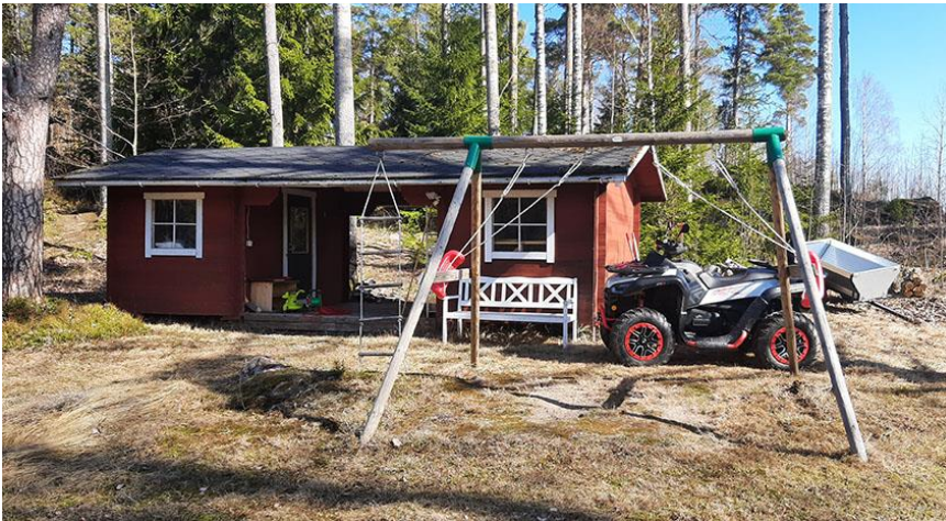
Kuva 2. Rakennuspaikan 1. liiteri.