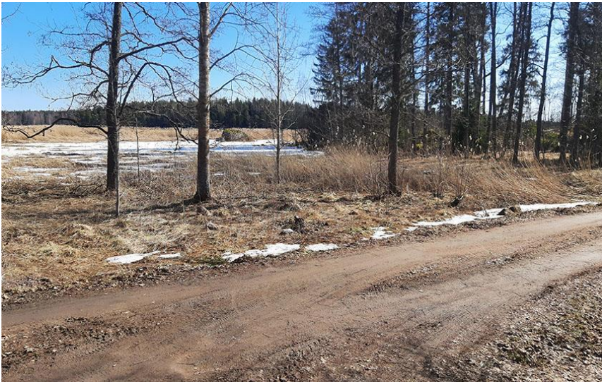
Kuva 8. Kaakkoisosassa oleva MY-1-alue.