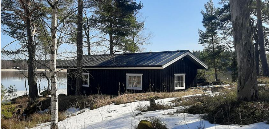
Kuva 13. Rakennuspaikan 2 koillisniemellä oleva venevaja.