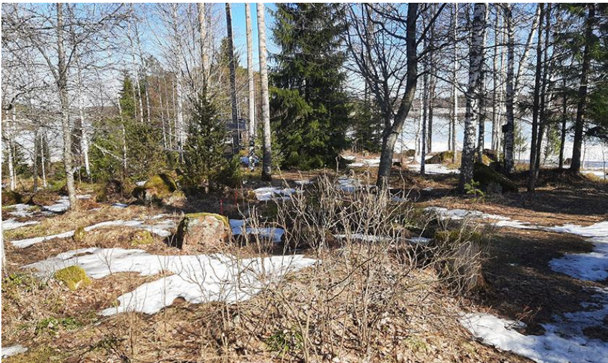
Kuva 14. Rakennuspaikan 2 pohjoisniemen sisäosan pihamaastoa. Puuston takana on rakennuspaikan sauna.