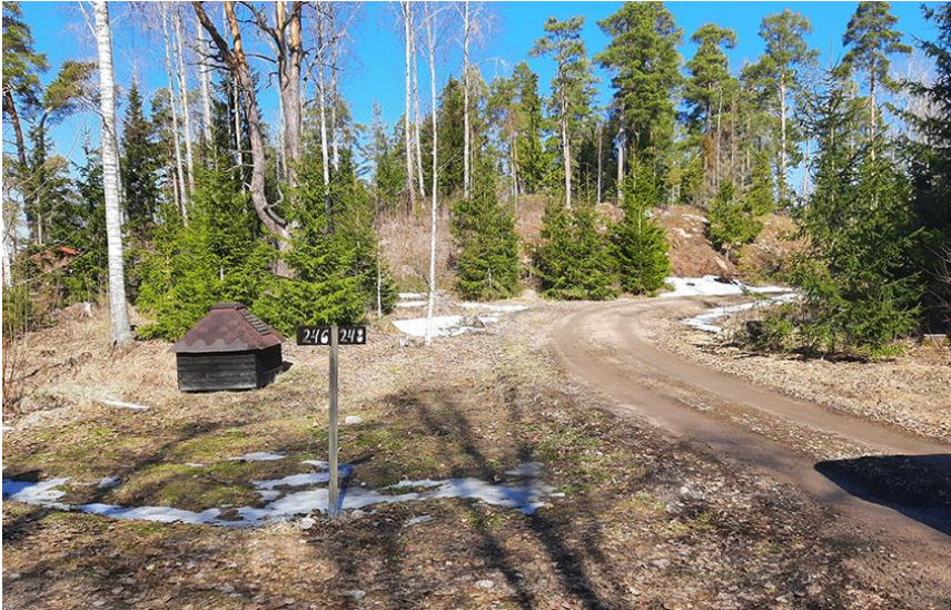
Kuva 4. Rakennuspaikan 1 keskikukkulalla oleva rakennusala kuvattuna etelästä sisääntulotien kohdalta.