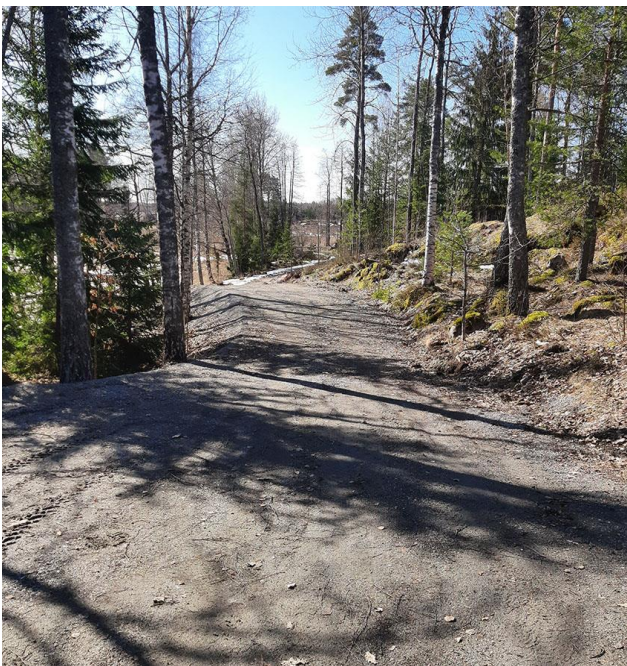
Kuva 15. Rakennuspaikan 2 sisääntulotie eteläsuuntaan, tien eteläosa on kuvassa 5.