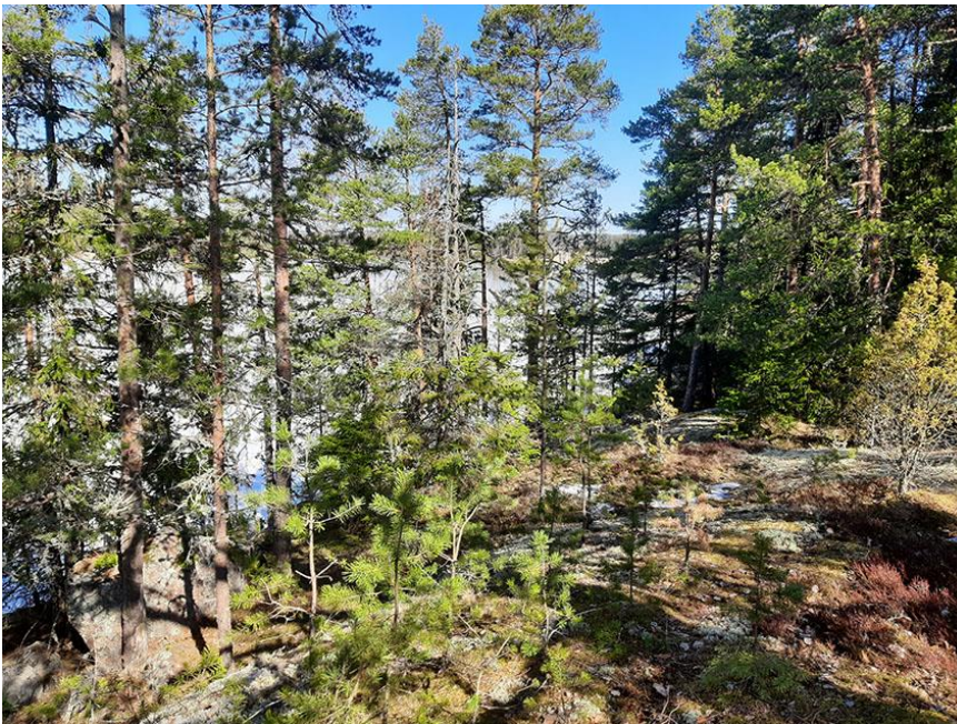
Kuva 3. Rantakasvillisuutta rakennuspaikan 1 mökin pohjoispuolella.