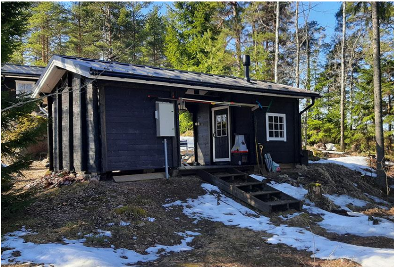
Kuva 11. Rakennuspaikan 2 mökin pohjoispuolella oleva liiteri.