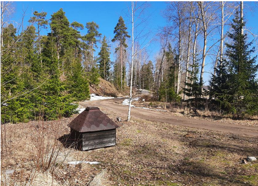
Kuva 5. Pääsytie rakennuspaikalle 2 Storholmenin itärantaa pitkin.