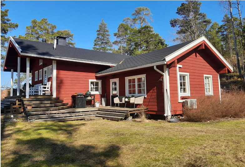
Kuva 1. Rakennuspaikan 1. lomamökki.