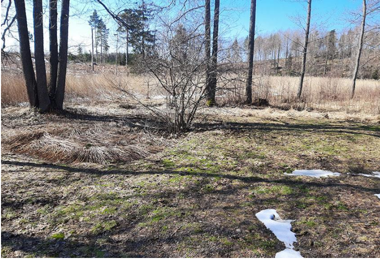
Kuva 7. Rakennuspaikan 1 eteläpuolella oleva MY-1-alue.