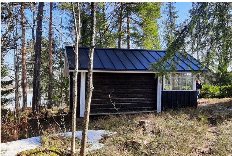
Kuva 12. Rakennuspaikan 2 mökin itäpuolella oleva liiteri.