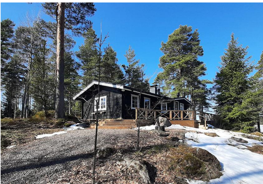
Kuva 9. Rakennuspaikan 2 vapaa-ajanmökki.