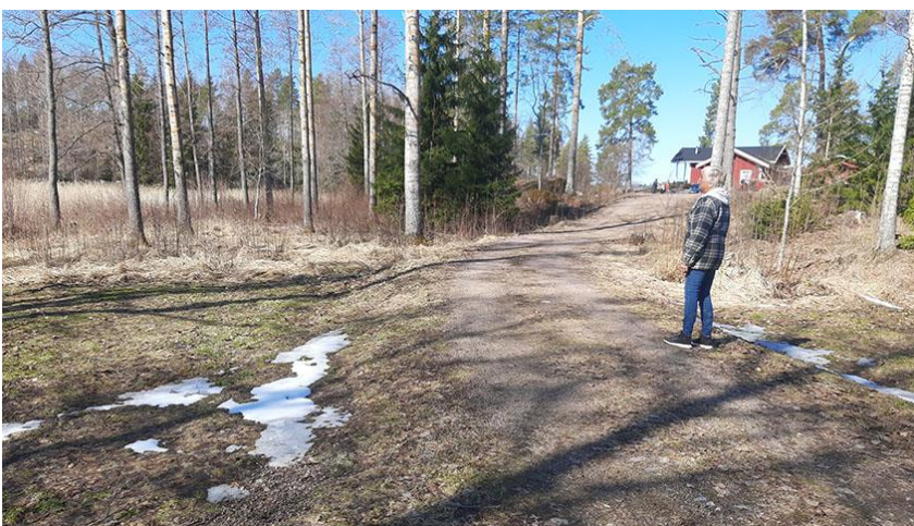
Kuva 6. Rakennuspaikan 1 sisääntulotie. Vasemmalla oleva alue on osoitettu MY-1-alueeksi. Maanomistaja mukana kuvassa.