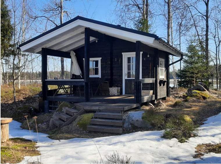
Kuva 10. Rakennuspaikan 2 sauna.